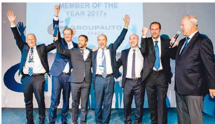
IL TEAM GROUPAUTO ITALIA NEL MOMENTO DELLA CONSEGNA DEL PREMIO "MEMBER OF THE YEAR 2017" DURANTE IL SUPPLIERS MEETING DI MALTA.

traverso uno strumento flessibile, configurato per i diversi paesi, in grado di integrare gli operatori di assistenza, di lavorare sempre nelle lingue locali e di essere trasparente e reattivo, per seguire al meglio la nostra rete Top Truck in qualsiasi momento e luogo.